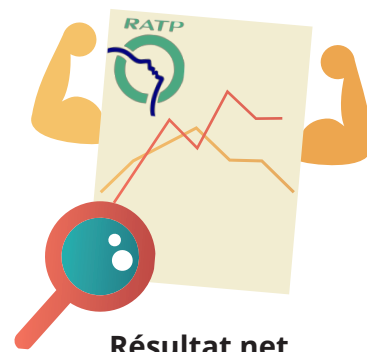
Résultat net 2016 & 2017

▶ La CGT-RATP a déposé une alarme sociale pour exiger la réouverture des négociations sur les salaires ■